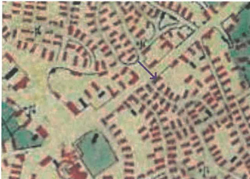
Habsburg Birodalom - Kataszteri térképek (XIX. század)

A tervezett felújítással érintett épület építészeti értékét jelzi, hogy már a Magyar Királyság (1819–1869) Második katonai felmérésén is megtalálható. Pontosabban ábrázolja a Habsburg birodalom XIX. századi kataszteri térképe.